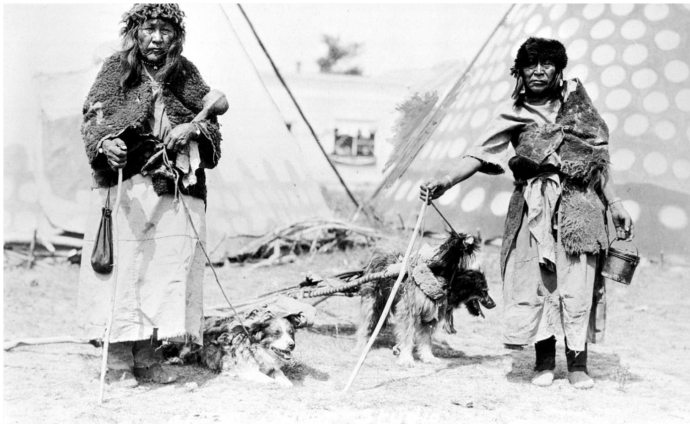
Les chiens aussi tirent les travois. Archives du musée Glenbow NA-1463-1